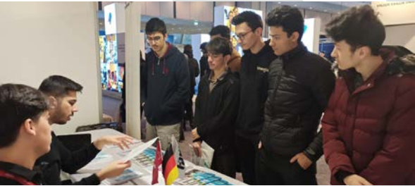
Lütfi Kırdar Kongre ve Sergi Sarayı Lütfi Kırdar Convention and Exhibition Center