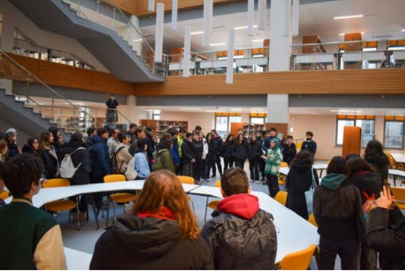
Bahçelievler Anadolu Lisesi Ziyareti Das Anatolisches Gymnasium Bahçelievler besuchte uns

16 Şubat 2023 Cuma günü özel kontenjan liselerimiz arasında yer alan Bahçelievler Anadolu Lisesi öğrencilerini kampüsümüzde ağırladık. Yabancı Diller Yüksekokulu Konferans Salonunda Üniversitemiz genel tanıtım sunumu ile başlayan program, soru-cevap bölümüyle devam etti. Aday öğrencilerin Üniversitemiz hakkında sorularına cevap bulduğu tanıtım etkinliği kampüs turu ve fotoğraf çekimiyle son buldu.