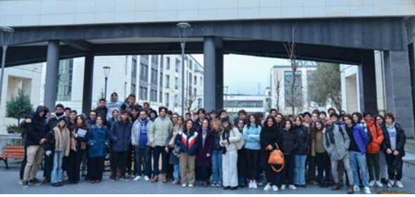
Özel Alman Lisesini Ağırladık Deutsches Gymnasium zu Gast an der TDU