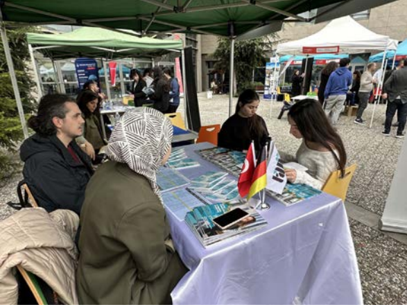
Sev Amerikan Koleji Sev American College

27 Mart 2024 tarihinde Basın ve Halkla İlişkiler Koordinatörlüğü olarak Sev Amerikan Kolejinin düzenlediği Unimeet Üniversiteler Buluşması etkinliğinde yer aldık. Standımızda Türk-Alman Üniversitesini tanıtarak öğrencilere bölümler, eğitim öğretim süreçleri, kampüs hayatı, çok dilli kurumsal yapı, Almanca dil eğitimi ve uluslararası olanaklar kapsamında bilgilendirmede bulunduk.