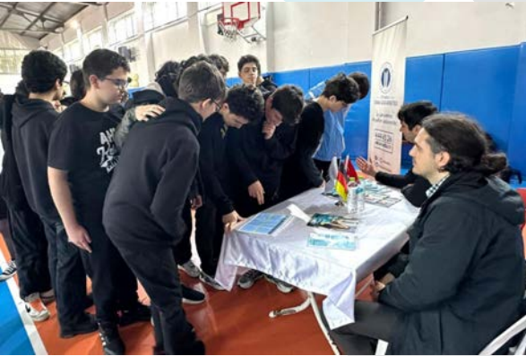
Üsküdar Ahmet Keleşoğlu Anadolu Lisesi Ahmet Keleşoğlu Gymnasium Üsküdar

Das Bahçelievler Gymnasium, eines unserer speziellen Quotengymnasien, war am Freitag, den 16. Februar 2024, zu Gast auf unserem Campus. Das Programm begann mit einer allgemeinen Vorstellung unserer Universität und wurde mit einer Frage- und Antwortrunde fortgesetzt. Die Veranstaltung, bei der Studieninteressierte Antworten auf ihre Fragen zu unserer Universität erhielten, endete mit einer Campus-Tour und einem Fotoshooting.