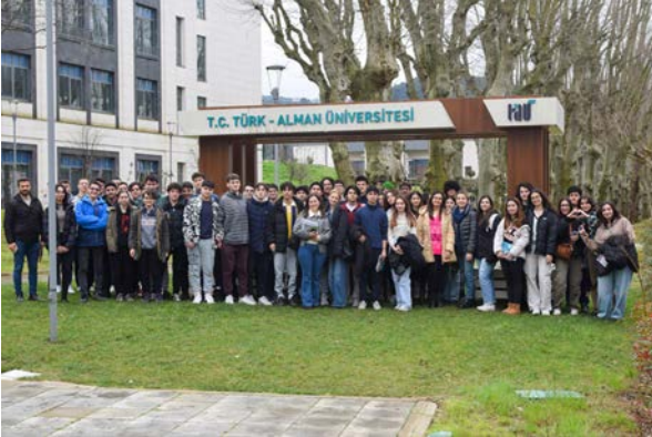
Kartal Anadolu Lisesi Ziyareti Das Kartal Gymnasium besuchte uns

Als Koordinationsstelle für Presse- und Öffentlichkeitsarbeit haben wir am 6. März 2024 an den Karrieretagen des Cağaloğlu Gymnasiums, einem unserer speziellen Quotengymnasien, teilgenommen. An unserem Stand haben wir unsere Universität vorgestellt und Informationen über die Fakultäten, das Campusleben, die deutschsprachige Ausbildung, den Ausbildungsprozess, die mehrsprachige Unternehmensstruktur und die internationalen Möglichkeiten mit den Studierenden geteilt.