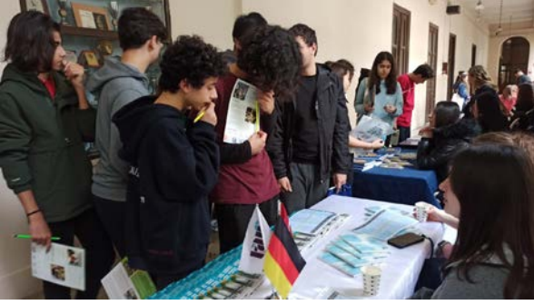
Cağaloğlu Anadolu Lisesi Cağaloğlu Gymnasium

Basın ve Halkla İlişkiler Koordinatörlüğü olarak 6 Mart 2024 tarihinde özel kontenjan liselerimiz arasında bulunan Cağaloğlu Anadolu Lisesinin düzenlediği Kariyer Günleri etkinliğinde yer aldık. Standımızda Üniversitemizi tanıtarak öğrencilerle fakülteler, kampüs hayatı, Almanca dil eğitimi, eğitim öğretim süreci, çok dilli kurumsal yapı ve uluslararası imkanlar ile ilgili bilgiler paylaştık.