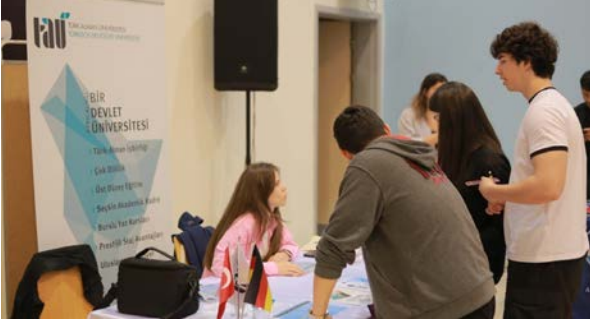
İTÜ GVO Ekrem Elginkan Lisesi TDU an der Hochschulmesse

Basın ve Halkla İlişkiler Koordinatörlüğü olarak 3 Mayıs 2024 tarihinde İTÜ GVO Ekrem Elginkan Lisesinin düzenlediği Üniversite Tanıtım Fuarı etkinliğinde yer aldık. Standımızda Üniversitemizi tanıtarak aday öğrencilere bölümler, eğitim öğretim süreçleri, kampüs hayatı, çok dilli kurumsal yapı, Almanca dil eğitimi ve uluslararası olanaklar kapsamında bilgi verdik.