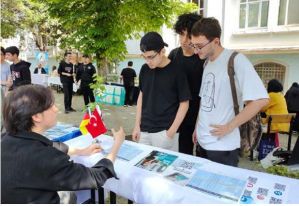
Fatih İlçe Milli Eğitim Müdürlüğü Kariyer Günleri Karrieretagen der Bezirksdirektion für Nationale Bildung in Fatih

Basın ve Halkla İlişkiler Koordinatörlüğü olarak 8-9 Mayıs 2024 tarihlerinde Fatih İlçe Milli Eğitim Müdürlüğü tarafından düzenlenen Kariyer Günleri etkinliğinde yer aldık. Standımızda Üniversitemizi tanıtarak öğrencilerle fakülteler, kampüs hayatı, Almanca dil eğitimi, eğitim öğretim süreci, çok dilli kurumsal yapı ve uluslararası imkanlar ile ilgili bilgiler paylaştık.