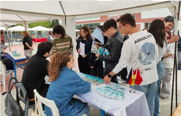
Özel ALEV Lisesi ALEV-Gymnasiums