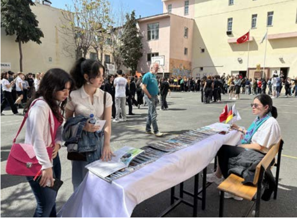
Çemberlitaş Anadolu Lisesi Çemberlitaş Gymnasium