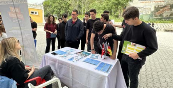
Kariyer Günleri Karrieretagen

Basın ve Halkla İlişkiler Koordinatörlüğü olarak 24-26 Nisan 2024 tarihleri arasında farklı kurumlar tarafından düzenlenen kariyer günü etkinliklerine katılarak aday öğrencilerle buluştuk. Bu kapsamda 24 Nisan 2024 tarihinde Validebağ Fen Lisesi tarafından düzenlenen 6. Kariyer Günleri, 25-26 Nisan 2024 tarihlerinde Beşiktaş İlçe Milli Eğitim Müdürlüğü tarafından düzenlenen Beşiktaş Kariyer Günleri ve 26 Nisan 2024 tarihinde Kavacık Nazmi Arıkan Fen Bilimleri Anadolu Lisesi tarafından düzenlenen Kariyer Günü etkinliklerinde yer aldık. Açtığımız stantlarda Üniversitemizi tanıtarak öğrencilerle fakülteler, kampüs hayatı, Almanca dil eğitimi, eğitim öğretim süreci, çok dilli kurumsal yapı ve uluslararası imkanlar ile ilgili bilgiler paylaştık.