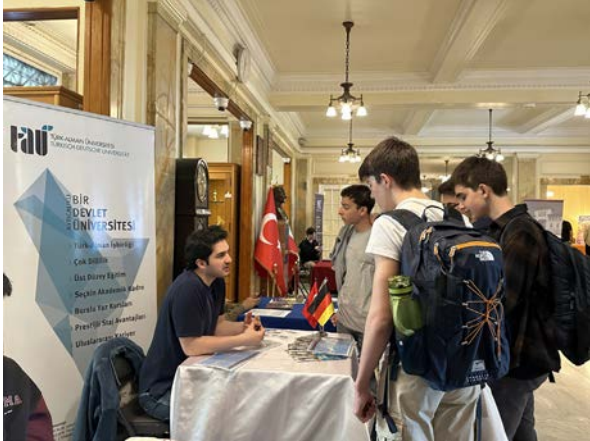
Özel Amerikan Robert Lisesi Robert Gymnasiums

Als Koordinationsstelle für Presse- und Öffentlichkeitsarbeit haben wir am 3. Mai 2024 an dem von der ITU GVO Ekrem Elginkan Gymnasium organisierten Hochschulvorstellungsmesse teilgenommen. An unserem Stand stellten wir unsere Universität vor und informierten Studieninteressierte über Fachbereiche, Bildungs- und Ausbildungsprozesse, Campusleben, mehrsprachige Unternehmensstruktur, deutschsprachige Ausbildung und internationale Möglichkeiten.