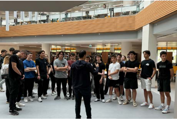
ALKEV Özel Anadolu ve Fen Lisesini Kampüsümüzde Ağırladık ALKEV zu Besuch an der TDU

Als Koordinationsstelle für Presse- und Öffentlichkeitsarbeit haben wir zwischen dem 24. und 26. April 2024 an Karrieretagen verschiedener Institutionen teilgenommen und uns mit Studieninteressierten getroffen. In diesem Zusammenhang nahmen wir an den 6. Karrieretagen teil, die von dem Validebag Gymnasium am 24. April 2024 organisiert wurden, an den Beşiktaş Karrieretagen, die am 25. und 26. April 2024 organisiert wurden, und am Karrieretag, der von dem Kavacık Nazmi Arıkan Gymnasium am 26. April 2024 organisiert wurde. An den Ständen, die wir eröffneten, stellten wir unsere Universität vor und tauschten mit den Studierenden Informationen über die Fakultäten, das Campusleben, die deutschsprachige Ausbildung, den Bildungs- und Ausbildungsprozess, die mehrsprachige Unternehmensstruktur und die internationalen Möglichkeiten aus.