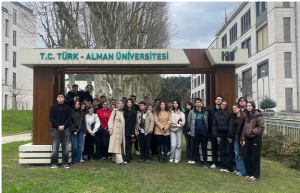
Maltepe Sınav Kurs Öğrencilerini Üniversitemizde Ağırladık Besuch des Maltepe Sınav Kurs an unserer Universität