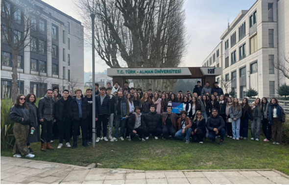
İzmir Yunus Emre Anadolu Lisesi Öğrencilerinin Üniversitemizi Ziyareti Besuch der Schülerinnen und Schüler des Yunus Emre Anatolischen Gymnasiums an unserer Universität