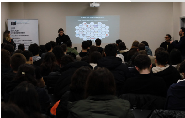
Bahçelievler Anadolu Lisesi Öğrencilerinden Üniversitemize Ziyaret Besuch von Schülern des Bahçelievler Anatolischen Gymnasiums an unserer Universität