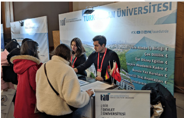
Üniversitemiz EKET Üniversite Tanıtım ve Tercih Fuarı'na Katıldı Unsere Universität nahm an der Hochschulinformations- und Studienwahlmesse EKET teil