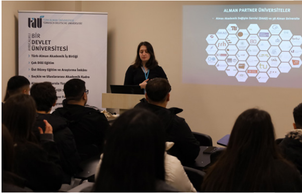
Bahçelievler Cumhuriyet Final Akademi Anadolu Lisesi Öğrencilerini Üniversitemizde Ağırladık Besuch des Bahçelievler Cumhuriyet Final Akademi Gymnasiums an unserer Universität

Koordinierungsstelle für Kommunikation der TDU hat als Büro für Hochschulkommunikation im Zeitraum Januar bis März 2026 Studieninteressierte aus verschiedenen Einrichtungen auf unserem Campus empfangen. In den im Präsentationssaal der Koordinierungsstelle für Kommunikation organisierten Programmen wurden detaillierte Informationen über die akademische Struktur, den Bildungsansatz und die sozialen Möglichkeiten unserer Universität vermittelt. Im Frage-Antwort-Teil wurden die Themen behandelt, die die Studierenden interessierten, und die Informationsveranstaltungen endeten mit einer Campus-Führung.