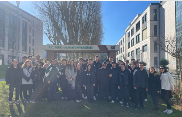
Özel Anabilim Anadolu ve Fen/Teknoloji Lisesi Öğrencilerini Üniversitemizde Ağırladık Wir begrüßten die Schülergruppe des Privaten Anabilim Anatolischen Gymnasiums und Naturwissenschaftlich-Technischen Gymnasiums an unserer Universität