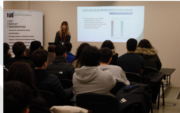
Özel Doğan Anadolu Lisesi Öğrencilerinden Üniversitemize Ziyaret Besuch von Schülern des Privaten Doğan Anatolischen Gymnasiums an unserer Universität