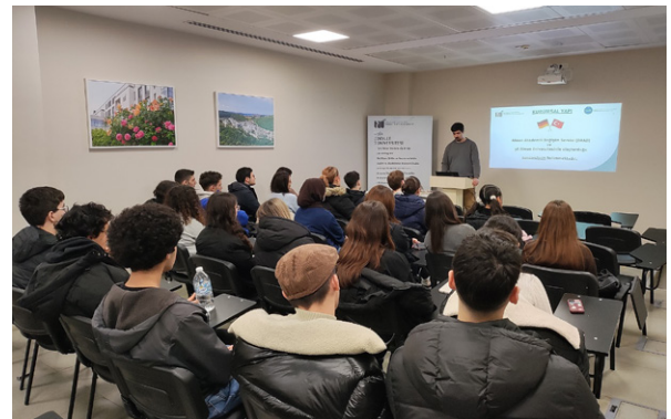
Üsküdar Ahmet Keleşoğlu Anadolu Lisesi Öğrencileri Üniversitemizi Ziyaret Etti Schülerinnen und Schüler des Üsküdar Ahmet Keleşoğlu Anatolischen Gymnasiums besuchten unsere Universität