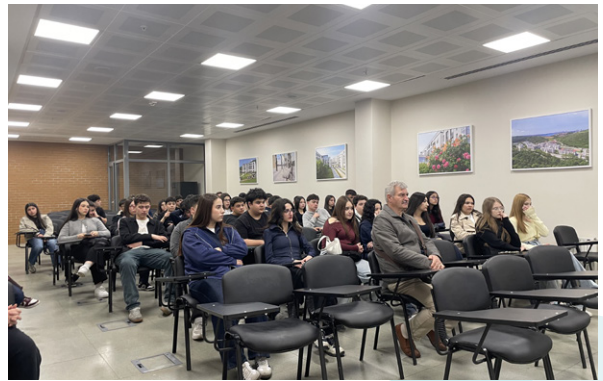
Salihli Necip Fazıl Kısakürek Sosyal Bilimler Lisesi Öğrencilerinin Üniversitemizi Ziyareti Besuch der Schülerinnen und Schüler des Salihli Necip Fazıl Kısakürek Gymnasiums für Sozialwissenschaften an unserer Universität