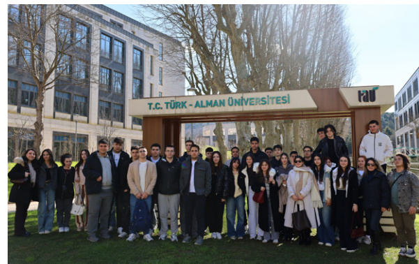
Özel Kartal Okyanus Koleji Öğrencilerinden Üniversitemize Ziyaret Besuch von privaten College Kartal Okyanus an unserer Universität