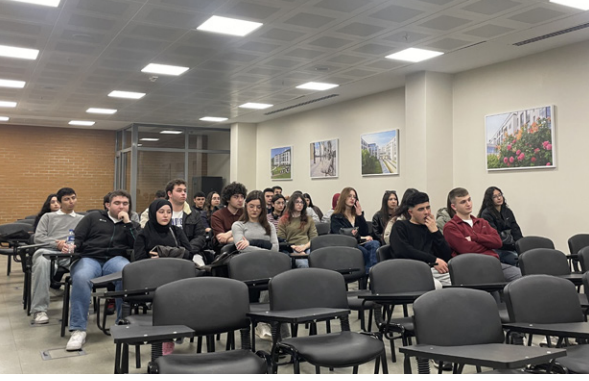
Üniversitemiz Yıldız-Ahmet Arayıcı Anadolu Lisesi Öğrencilerini Ağırladı Unsere Universität empfing die Schülerinnen und Schüler des Yıldız-Ahmet Arayıcı Anatolischen-Gymnasiums