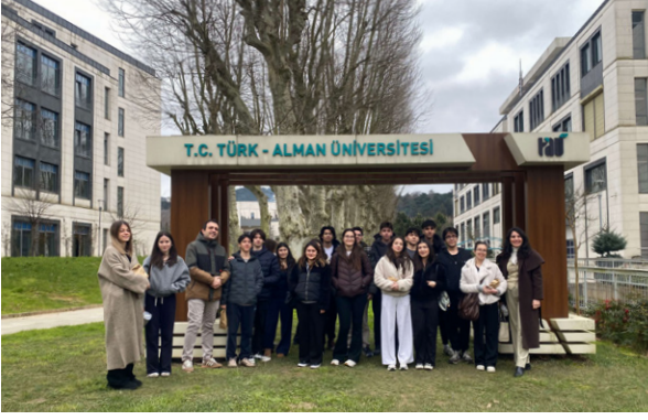
İstek Belde Anadolu ve Fen Lisesi Öğrencileri Üniversitemizi Ziyaret Etti Schülerinnen und Schüler des İstek Belde Anatolischen und Naturwissenschaftlichen Gymnasiums besuchten unsere Universität