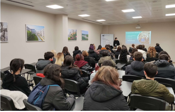
Semiha Şakir Anadolu Lisesi Öğrencilerinin Üniversitemizi Ziyareti Besuch des Semiha-Şakir-Anatolischen Gymnasiums an unserer Universität