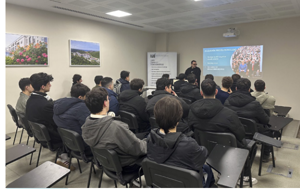
Şehit Servet Asmaz Anadolu İmam Hatip Lisesi Öğrencilerini Üniversitemizde Ağırladık Wir begrüßten die Schülerinnen und Schüler des Şehit Servet Asmaz İmam Hatip Gymnasiums an unserer Universität