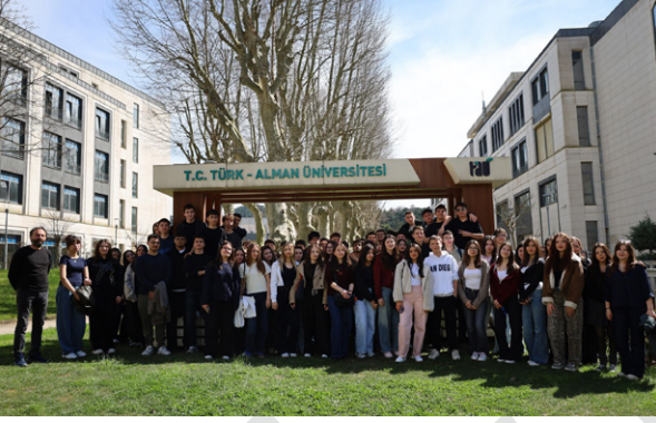
Şehit Mehmet Şengül Fen Lisesi Öğrencilerini Kampüsümüzde Ağırladık Wir begrüßten die Schülerinnen und Schüler des Şehit Mehmet Şengül Naturwissenschaftlichen Gymnasiums an unserer Universität