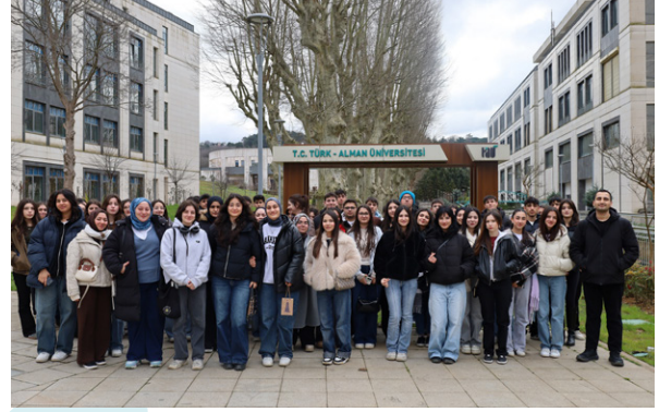
Yenidoğan Anadolu Lisesi Öğrencilerinin Üniversitemizi Ziyareti Besuch des Yenidoğan Anatolischen Gymnasiums an unserer Universität