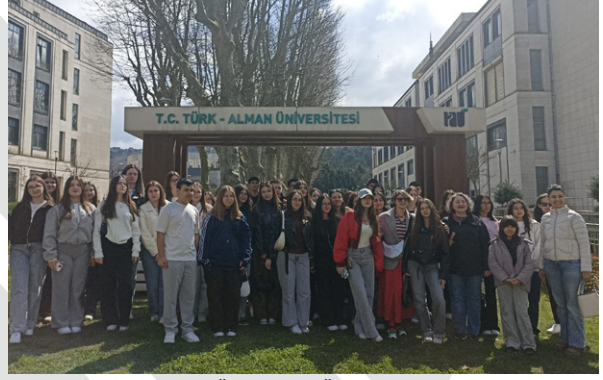
Düvenciler Anadolu Lisesi Öğrencilerini Üniversitemizde Ağırladık Wir begrüßten die Schülerinnen und Schüler der Düvenciler Anatolischen Gymnasiums an unserer Universität begrüßt