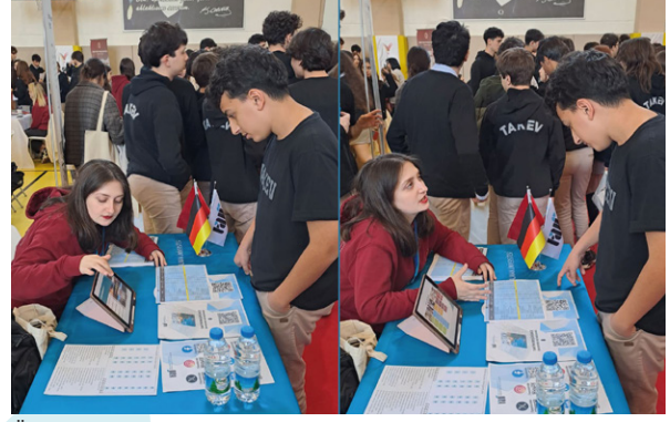
Üniversitemiz TAKEV Okullarında Gerçekleşen "Kariyer Haftası"na Katıldı Unsere Universität nahm an der Karriereweche der TAKEV Schulen teil.