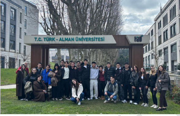
Nişantaşı Nuri Akın Anadolu Lisesi Öğrencilerini Üniversitemizde Ağırladık Wir begrüßten die Schülerinnen und Schüler des Nişantaşı Nuri Akın Anatolischen Gymnasiums an unserer Universität