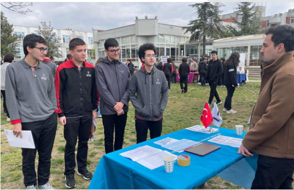
TÜBİTAK Fen Lisesi Kariyer Günü'nde Üniversitemizi Tanıttık Wir haben unsere Universität beim Karrieretag des TÜBİTAK Naturwissenschaftlichen Gymnasiums vorgestellt