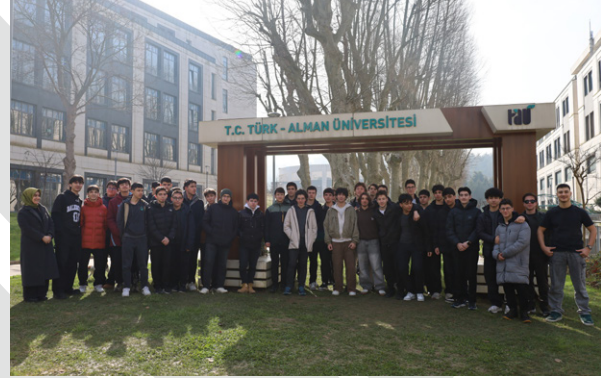
Üsküdar Anadolu İmam Hatip Lisesi Öğrencilerinin Üniversitemizi Ziyareti Besuch der Schülerinnen und Schüler der Üsküdar Anatolischen İmam Hatip Gymnasium an unserer Universität