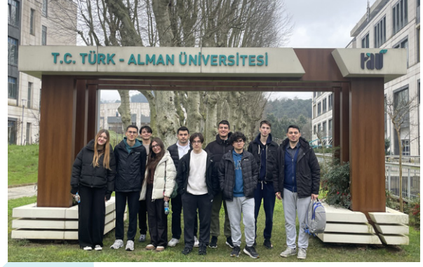
İstek Belde Anadolu ve Fen Lisesi Öğrencileri Üniversitemizi Ziyaret Etti Schülerinnen und Schüler des İstek Belde Anatolischen und Naturwissenschaftlichen Gymnasiums besuchten unsere Universität