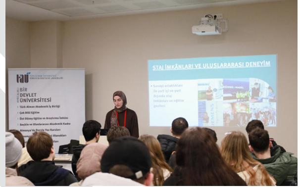
Özel Kurtköy Bayramlar Anadolu Lisesi Öğrencilerini Üniversitemizde Ağırladık Besuch des Özel Kurtköy Bayramlar Gymnasiums an unserer Universität