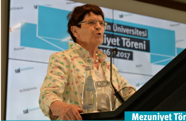
Mezuniyet Töreni Konuşmaları Reden bei der Abschlussfeier