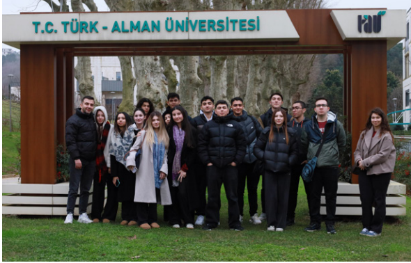
Özel Kağıthane Yönder Anadolu Lisesi Öğrencilerini Üniversitemizde Misafir Ettik Wir haben die Schülerinnen und Schüler des Privaten Kağıthane Yönder Anatolischen Gymnasiums an unserer Universität begrüßt