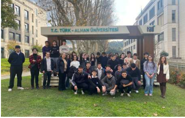
15 Temmuz Şehitler Fen Lisesi Öğrencilerini Üniversitemizde Ağırladık Wir begrüßten die Schülerinnen des 15 Temmuz Şehitler wissenschaftlichen Gymnasiums an unserer Universität