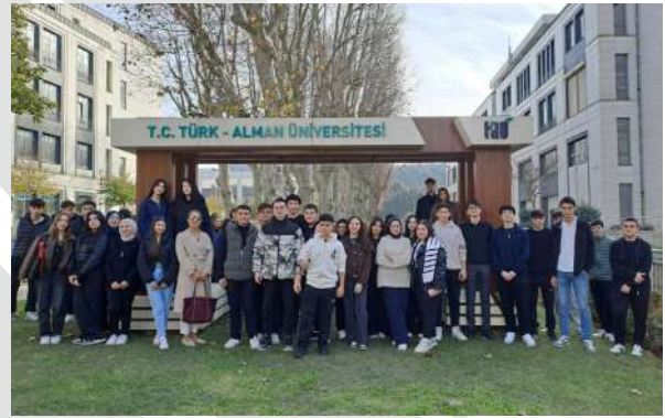
Beykoz Anadolu Lisesi Öğrencilerinden Üniversitemize Ziyaret Besuch der Schülerinnen und Schüler des Beykoz Anatolischen Gymnasium an unserer Universität