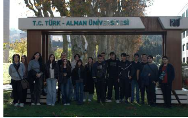
TED Alanya Koleji Özel Lisesi Öğrencilerini Ağırladık Wir begrüßten die Schülerinnen und Schüler des TED Alanya College Private Gymnasiums