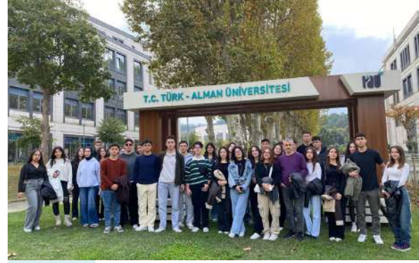
Manisa Sosyal Bilimler Lisesi Üniversitemizi Ziyaret Etti Besuch des Manisa Sozialwissenschaftlichen Gymnasiums an unserer Universität