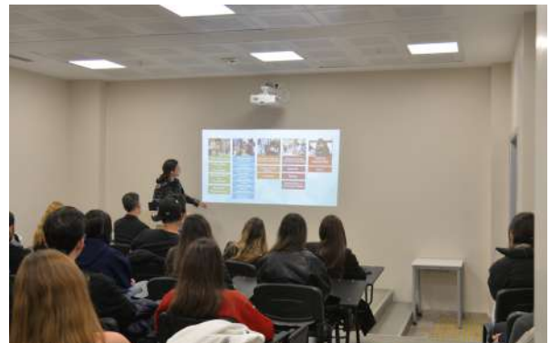
Özel Koşuyolu Caddem Anadolu Lisesi Öğrencilerini Üniversitemizde Ağırladık Besuch des Privaten Koşuyolu Caddem Anatolischen Gymnasiums an unserer Universität