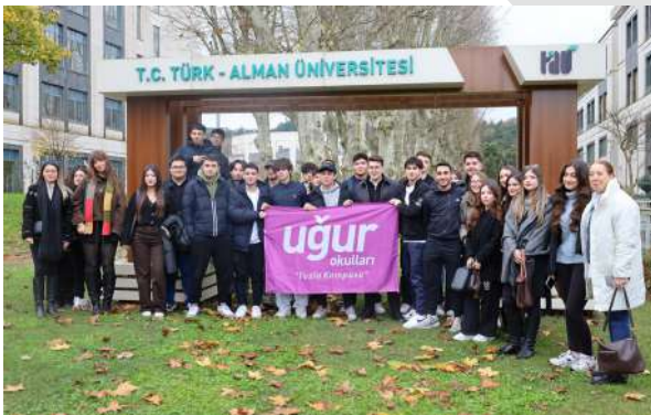
Özel Uğur Okulları Tuzla Kampüsü Öğrencilerini Üniversitemizde Ağırladık Wir begrüßten die Schülerinnen und Schüler der Privaten Uğur Schulen Tuz- la Campus an unserer Universität