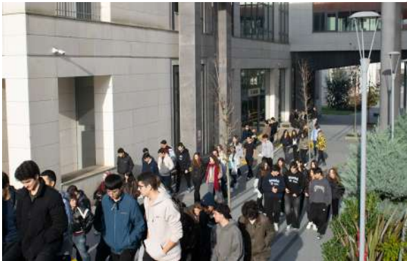
Özel Kontenjan Liselerimizden Kağıthane Anadolu Lisesi Öğrencilerini Üni- versitemizde Ağırladık Besuch des Kağıthane Anatolischen Gymnasiums, eines unserer speziellen Quotengymnasien, an unserer Universität