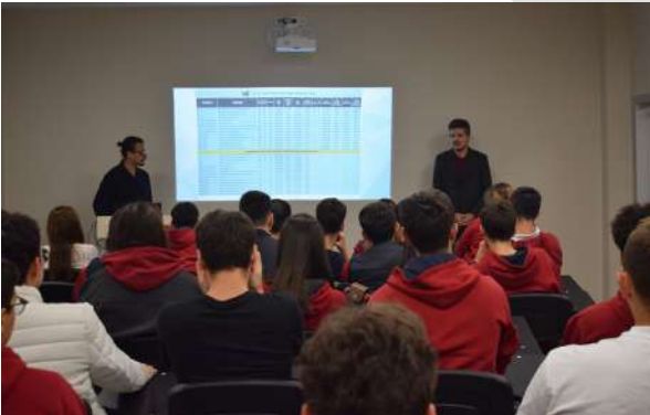
Özel Denizatı Anadolu Lisesi Öğrencileri Üniversitemizi Ziyaret Etti Schülerinnen und Schüler des Privaten Denizatı Anatolisches Gymnasiums besuchen unsere Universität