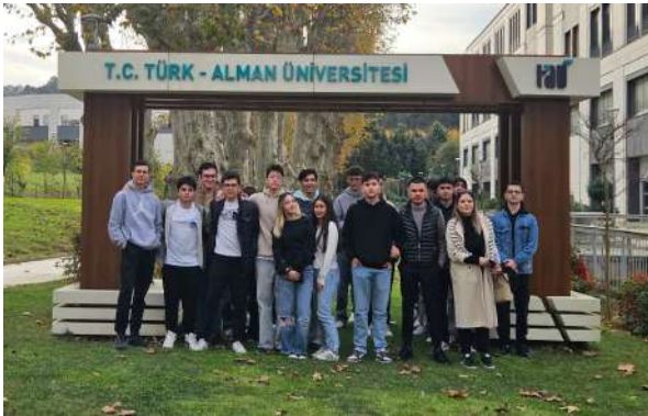
Özel Nazmi Arkan Fen Bilimleri Bahçelievler Anadolu Lisesi Üniversitemizi Ziyaret Etti Private Nazmi Arkan Wissenschafts- und Anatolisches Gymnasium besuchte unsere Universität