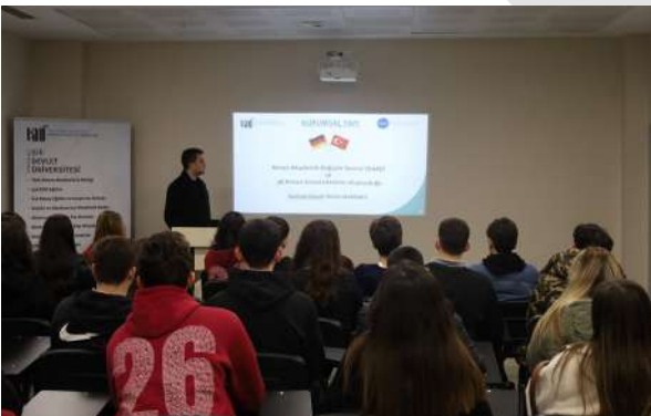
Sağmalcılar Anadolu Lisesi Öğrencileri Üniversitemize Konuk Oldu Besuch von Schülern der Sağmalcılar Anatolie Gymnasium an unserer Universität