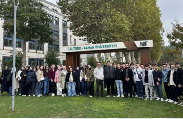
Özel Başakşehir Yenidoğru Fen Lisesi Öğrencilerini Ağırladık Wir begrüßten die Schülerinnen und Schüler des Privaten Başakşehir Yenidoğru Naturwissenschaftlichen Gymnasiums

Koordinierungsstelle für Kommunikation der TDU hat als Büro für Hochschulkommunikation im Zeitraum Oktober bis Dezember 2025 zahlreiche Studieninteressierte aus verschiedenen Einrichtungen auf unserem Campus empfangen. Im Rahmen der Veranstaltungen im Informationsraum der Koordinierungsstelle für Kommunikation wurden detaillierte Informationen über die akademische Struktur, den Bildungsansatz und die sozialen Möglichkeiten unserer Universität vermittelt. Im Frage-Antwort-Teil wurden die Themen behandelt, die die Studierenden interessierten, und die Informationsveranstaltungen endeten mit einer Campus-Führung.