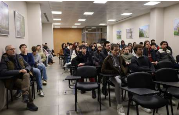
TEV İnanc Türkes Özel Lisesi Öğrencilerinden Üniversitemize Ziyaret Besuch von Schülern des TEV İnanc Türkes Privaten Gymnasiums an unserer Universität