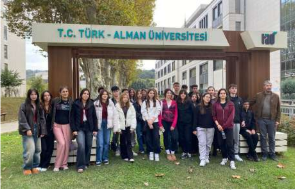
Turgutlu Anadolu Lisesi Öğrencileri Üniversitemizi Ziyaret Etti Schülerinnen und Schüler des Turgutlu Anatolischen Gymnasiums zu Gast an unserer Universität