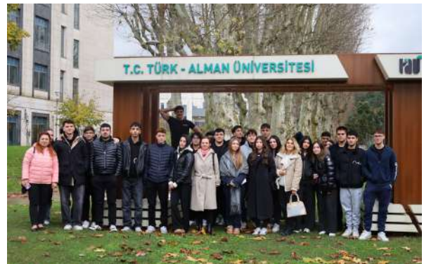
Arel Fen Lisesi Öğrencilerini Üniversitemizde Ağırladık Wir begrüßten die Schülerinnen und Schüler des Arel Wissenschaftlichen Gym- nasiums an unserer Universität