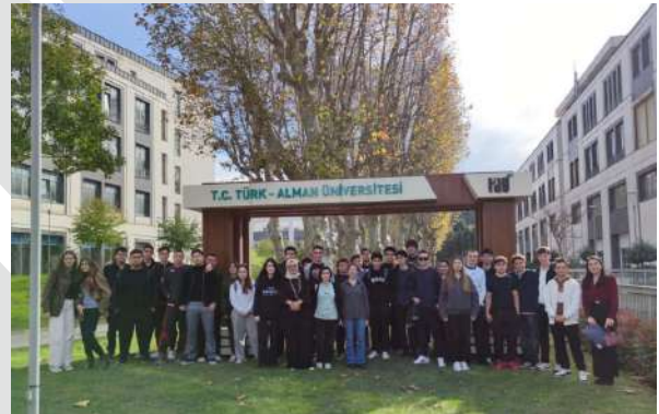
Hayrullah Kefoğlu Anadolu Lisesi Öğrencilerinden Üniversitemize Ziyaret Besuch der Schülerinnen und Schüler des Hayrullah Kefoğlu Anatolischen Gymnasiums an unserer Universität