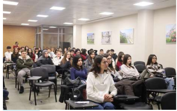
Üniversitemiz Habibler Anadolu Lisesi Öğrencilerini Ağırladı Unsere Universität empfing Schülerinnen und Schüler des Habibler Anatolischen Gymnasiums