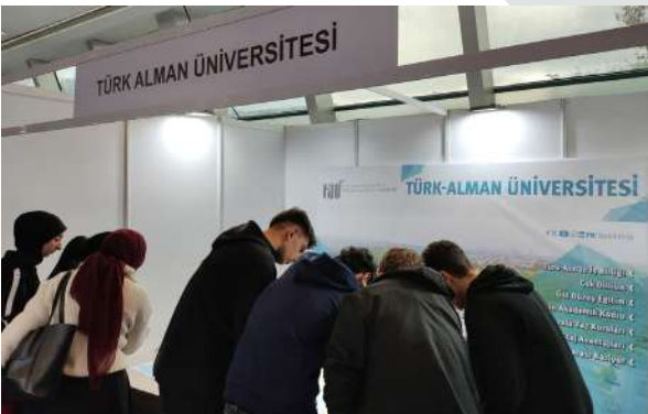
İstanbul Eğitim ve Kariyer Günleri'nde Aday Öğrencilerle Buluştuk Wir haben uns auf den Bildungs- und Karrieretagen in Istanbul mit Studieninteressierten getroffen.