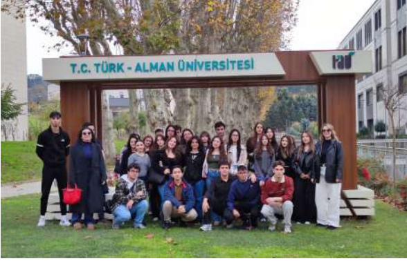
MBA Okulları Öğrencilerinden Üniversitemize Ziyaret Besuch der Schülerinnen und Schüler des MBA Gymnasiums an unserer Universität