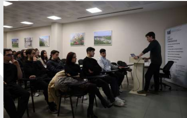
TEB Ataşehir Anadolu Lisesi Öğrencilerinden Üniversitemize Ziyaret Besuch von Schülern des TEB Ataşehir Anatolien Gymnasiums an unserer Universität