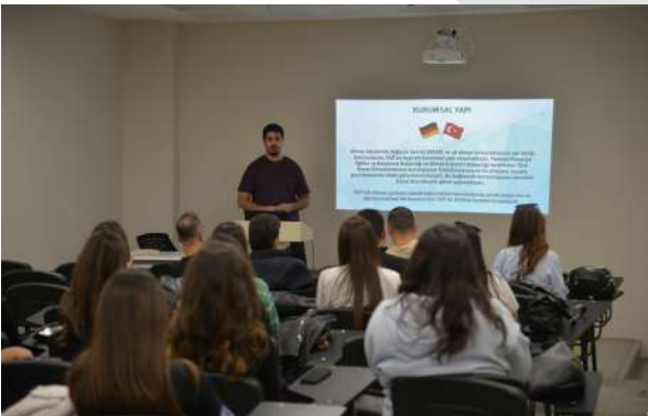
Özel Salihli Bahçeşehir Koleji Öğrencilerinden Üniversitemize Ziyaret Besuch vom Privaten College Salihli Bahçeşehir an unserer Universität