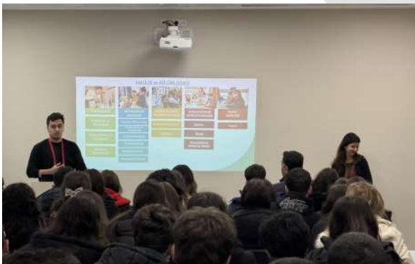
Educent Kolejinden Üniversitemize Ziyaret Besuch von Schülern des Educent College Gymnasiums an unserer Universität