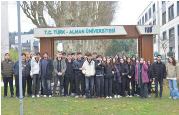
Erkut Soyak Anadolu Lisesinden Üniversitemize Ziyaret Besuch von Schülerinnen und Schülern des Erkut Soyak Anatolischen Gymnasiums an unserer Universität