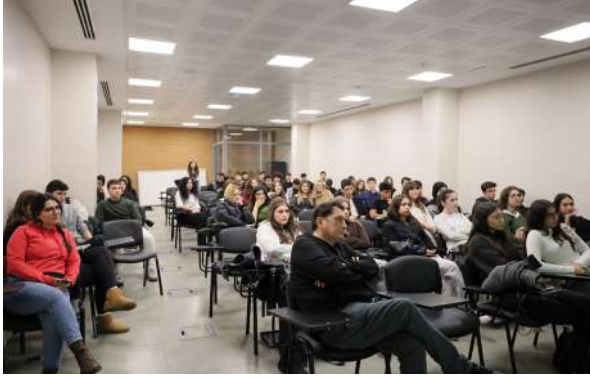
Kurtköy Nazmi Arkan Fen Bilimleri Anadolu Lisesi Öğrencilerinden Üniversitemize Ziyaret Besuch der Schülerinnen und Schüler des Kurtköy Nazmi Arkan Wissenschaftlichen- und Anatolischen-Gymnasiums an unserer Universität