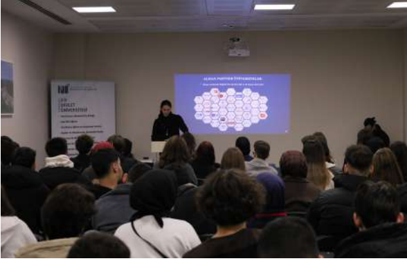
Özel Sultan Fatih Koleji Anadolu Lisesi Öğrencilerini Ağırladık Wir begrüßten die Schüler des Privaten Sultan Fatih College Anatolischen Gymnasiums