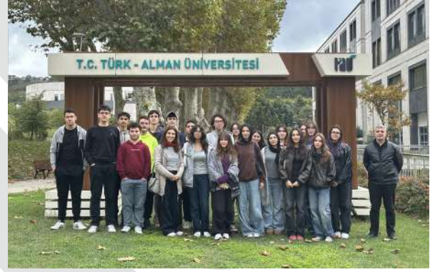
Prof. Dr. Fuat Sezgin Fen Lisesi Öğrencilerini Ağırladık Besuch von Schülerinnen und Schülern des Prof. Dr. Fuat Sezgin Naturwissenschaftlichen Gymnasiums