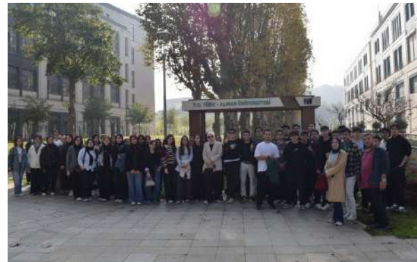
Özel Başakşehir Yenidoğru Anadolu Lisesi Öğrencilerini Üniversitemizde Ağırladık Wir hatten die Schülerinnen und Schüler vom Privaten College Salihli Bahçeşehir an unserer Universität zu Gast