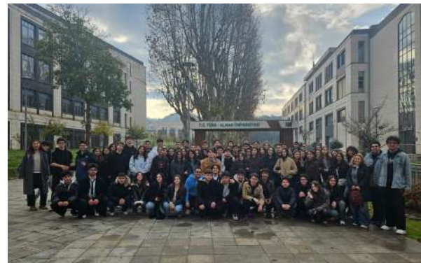
İstanbul Anadolu Lisesi Öğrencilerini Üniversitemizde Ağırladık Besuch des İstanbul Anatolischen Gymnasiums an unserer Universität