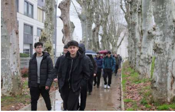
Özel Ümraniye GEN Koleji Öğrencilerini Üniversitemizde Ağırladık Wir begrüßten die Schüler des Privaten Ümraniye GEN College Gymnasiums