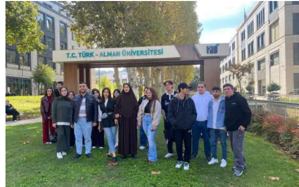
Esenyurt Belediyesi Sürekli Eğitim Merkezi Öğrencileri Üniversitemizi Ziyaret Etti Studierende des Weiterbildungszentrums der Gemeinde Esenyurt besuchte unsere Universität