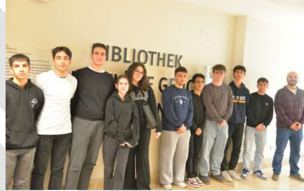
Sancaktepe Arif Nihat Asya Anadolu Lisesi Üniversitemizi Ziyaret Etti Das Sancaktepe Arif Nihat Asya Anatolische Gymnasium besuchte unsere Universität