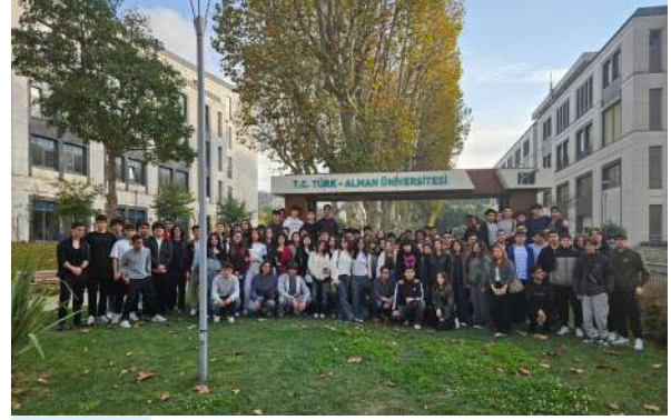
Antalya Anadolu Lisesi Öğrencileri Üniversitemizi Ziyaret Etti Besuch des Antalya Anatolischen Gymnasiums an unserer Universität