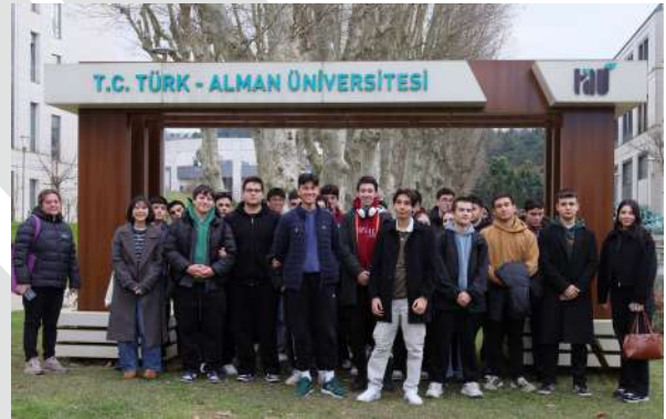
Üniversitemiz Paşabahçe Ahmet Ferit İnal Anadolu Lisesini Ağırladı Unsere Universität empfing das Paşabahçe Ahmet Ferit İnal Anatolische-Gymnasium