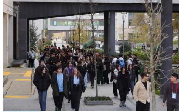
Çekmeköy Nazmi Arıkan Fen Bilimleri Anadolu Lisesi Öğrencilerini Üniversitemizde Ağırladık Wir Haben die Schülerinnen und Schüler des Çekmeköy Nazmi Arkan Anatolischen Gymnasium für Naturwissenschaften an Unserer Universität Begrüßt