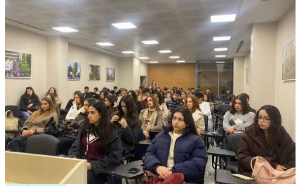
Özel İzmir TAKEV Fen ve Anadolu Liselerinden Öğrencileri Üniversitemizde Misafir Ettik Besuch des privaten anatolischen und wissenschaftlichen TAKEV-Gymnasi- ums İzmir an unserer Universität