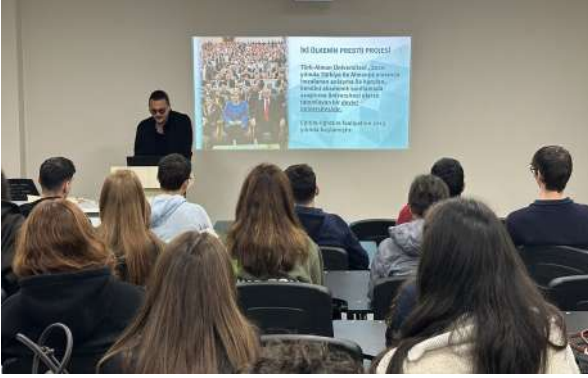
Özel Denizatı Anadolu Lisesi Öğrencilerini Üniversitemizde Ağırladık Besuch von Schülerinnen und Schülern des Anatolischen Gymnasiums