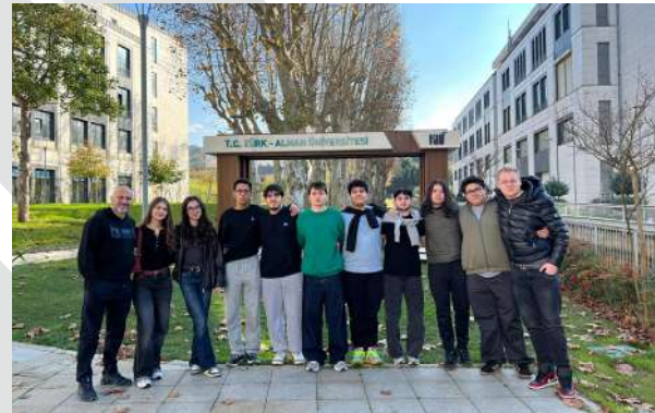
Isparta Doğa Koleji Öğrencilerini Üniversitemizde Ağırladık Besuch von dem Privaten College Isparta Doğa an unserer Universität