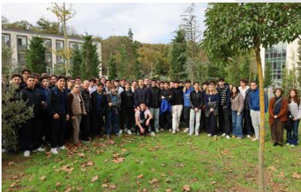
Özel Alman Lisesi Öğrencilerini Üniversitemizde Ağırladık Schülerinnen und Schüler des Privaten Deutschen Gymnasiums zu Gast an unserer Universität