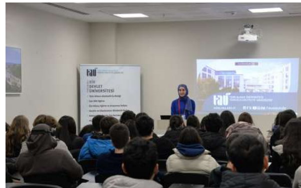
Kadir Has Anadolu Lisesi Öğrencilerinden Üniversitemize Ziyaret Besuch von Schülern des Kadir-Has-Anatolischen Gymnasiums an unserer Universität