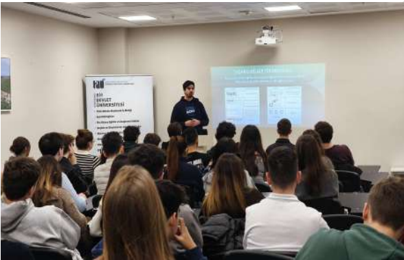
Özel Çakabey Okulları Öğrencilerinden Üniversitemize Ziyaret Besuch der Schülerinnen und Schüler der Privatschule Çakabey an unserer Universität