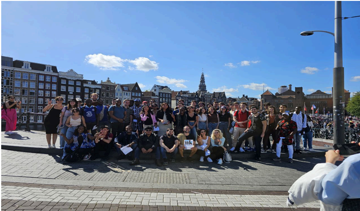
2022/2023 eğitim-öğretim yılında Almanya yaz kursuna gitmeye hak kazanan öğrencilerimiz