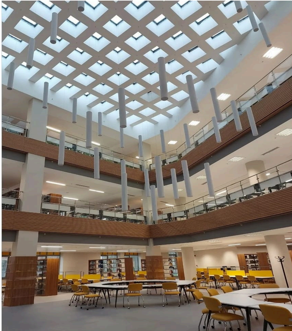
Mevlüde Genç Kütüphanesi

Üniversitemizin kütüphanesi tüm üniversite mensuplarının kullanımına açıktır. Gerekli bilgilere Kütüphane ve Dokümantasyon Daire Başkanlığı web sayfasından ulaşabilirsiniz.