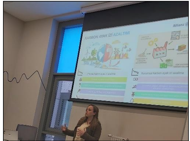
İklim Krizi ve Karbon Ayak İzi Eğitimi