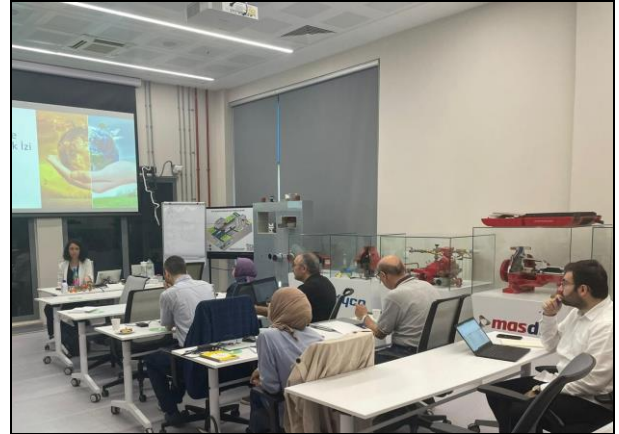
İklim Krizi ve Karbon Ayak İzi Eğitimi